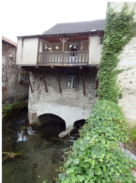
Vue arrière du Moulin Palassoé à Arudy, ancien moulin seigneurial racheté par les Palassoé au 19 e siècle

Nous avons découvert l'importance de ces moulins pour les habitants des villages ou des hameaux, depuis le moyen-âge jusqu'au 19 e siècle. C'est là que tous les habitants apportaient leur grain à moudre pour leur alimentation ou celle de leurs animaux. Quelquefois propriété de certaines communautés ils ont surtout appartenu à la classe seigneuriale qui les a construits ou accaparés en échange d'un entretien régulier contrôlé par les jurats. Il est évident que cette classe en retirait des profits inté-