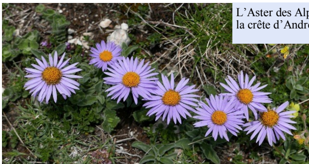
L'Aster des Alpes de la crête d'Andreyt

Sortie en partenariat avec les Amis du Parc National des Pyrénées) » et « ABBA (Association Botanique du Bassin de l'Adour) » dans le cadre des 50 ans du Parc.