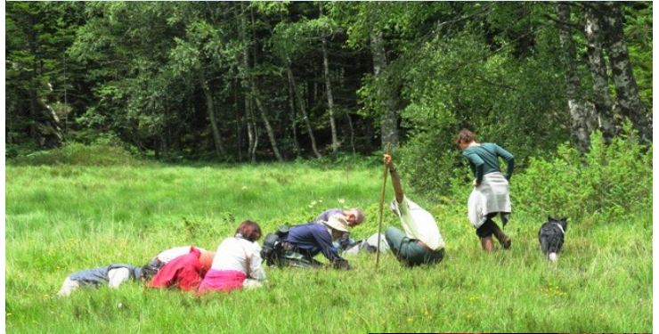
Groupe de naturophiles à l'affût dans les herbes de la tourbière

Le scoop du jour trouvé dans le bois près de la tourbière : un myxomycète, étrange être vivant unicellulaire, ni végétal, ni animal, ni champignon, capable de se déplacer et d'apprendre et qui fait l'objet d'étude au CNRS de Toulouse.