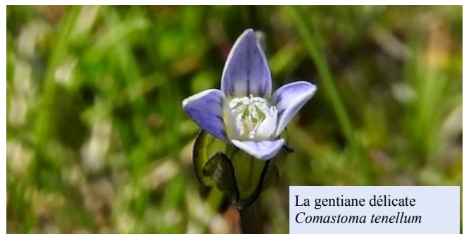
La gentiane délicate Comastoma tenellum