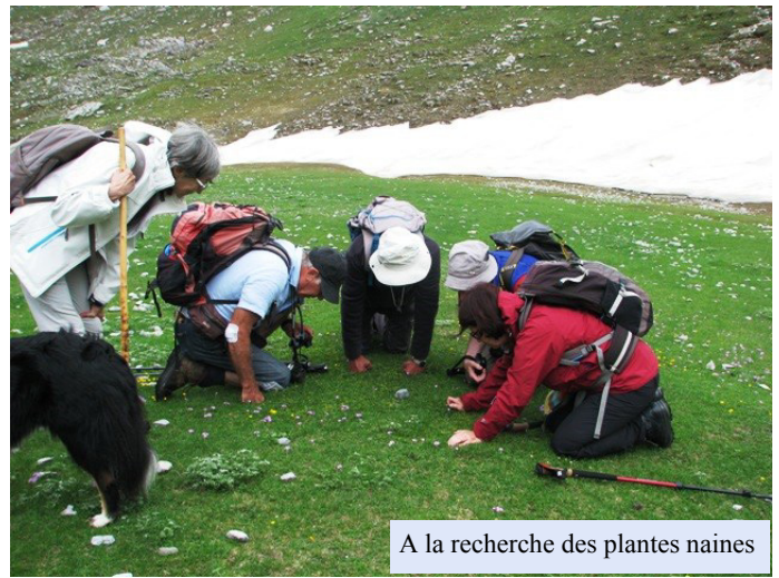
A la recherche des plantes naines

Nos explorations successives nous ont conduits plus haut vers la passe de Bourroux que nous n'avions pu atteindre l'an dernier. Et là nous découvrons une nouvelle végétation car la nature de la roche a changé : les grès et pétales siliceux nourrissent ici le génépi, la rare Woodsie (petite fougère) et la campanule fluette qui nous enchantent. De là-haut, la vue sur les lacs de Louesque est magnifique !