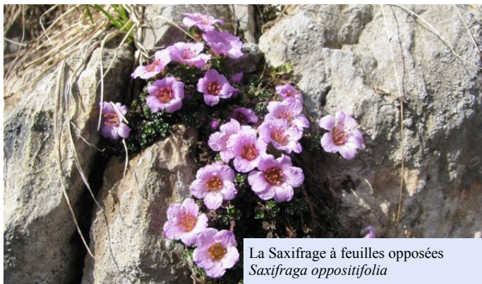
La Saxifrage à feuilles opposées Saxifraga oppositifolia

Ce qui frappe lorsqu'on arrive à l'entrée du clot, c'est la fraîcheur du lieu, maintenu par les hautes falaises calcaires de Bazen qui l'entourent et la végétation très rase. Partout des tapis de Dryades; Seraient-ce les Margalides ? Force est de reconnaître la ressemblance des Dryades avec les marguerites : « cœur » jaune et « pétales » blancs. Ceux qui ont nommé cet endroit les avaient sûrement remarquées aussi. Les dryades sont des reliques glaciaires, plantes des steppes nordiques et elles sont ici dans leur milieu favori. D'autres plantes de toundra les accompagnent : les saules nains (réticulé et à feuilles rétuses) ainsi que la Saxifrage à feuilles opposées, la plante qui monte le plus haut en France, donc amie du froid elle aussi. Toutes ces espèces constituent un tapis ponctué de petites taches de couleur sur lequel nous marchons. Parfois affleurent les racines et branches des saules hauts de 5 cm. Les plantes sont ici soumises à des conditions climatiques très dures ! Magique !