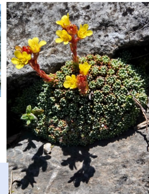
La Saxifrage faux arétie Saxifraga aretioides