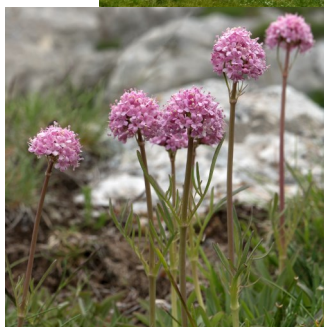
La Valériane tubéreuse Valeriana tuberosa