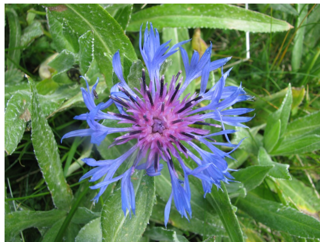
Le Bleuet de montagne / Cyanus montanus Cette sauvageonne a séduit plus d'un jardinier !