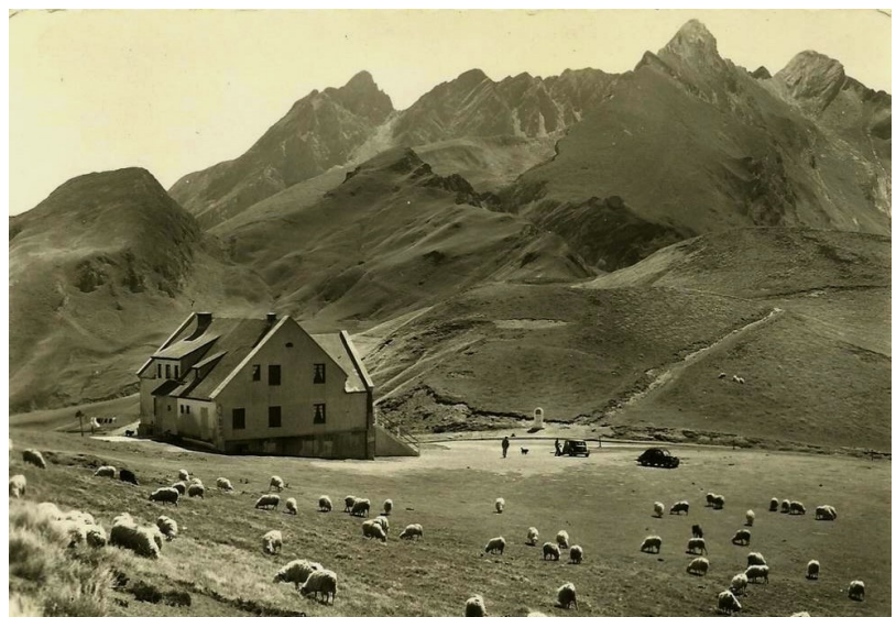
Le col d'Aubisque et les montagnes de Béost (Du Gabizos à la Latte de Bazen)