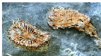
Les coraux de Peyreget, un vestige du milieu marin