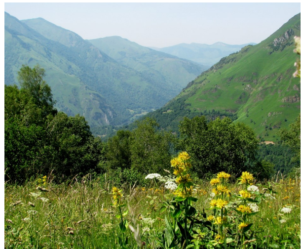
Les gentianes ( Gentiana lutea ) colorent les prairies fleuries de la Montagne verte.

Pour terminer, le 16 juin nous avons exploré les pentes du défilé de Tourmont et les abords du col du Pourtalet magnifiquement fleuris. Les Bleuets de montagne nous ont fait oublier que les Sabots de Vénus étaient fanés côté espagnol.