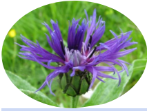
Le Bleuet de montagne à Tourmont ( Cyanus montanus )

C'est à l'occasion des 30 ans de l'Association que nous avons tenté d'organiser les premières journées botaniques de Pierrine. Quelle bonne initiative ! Depuis quelques années nous avons souvent eu du mal à réunir une poignée de participants chaque fois que nous organisons des sorties botaniques. Et cette année nous avons