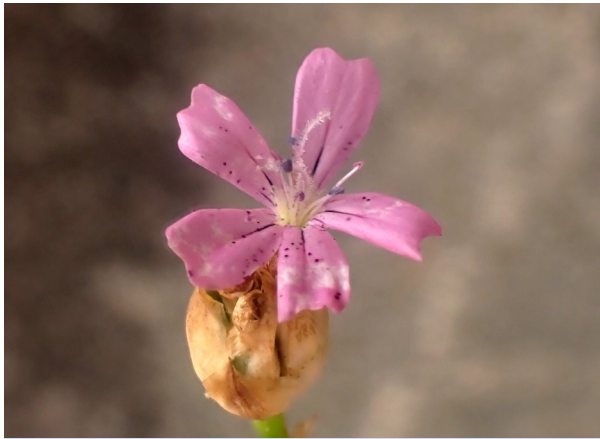
La Tunique prolifère ( Petrorhagia prolifera ), une plante qui habitait les champs de Bagès et qui survit dans les friches d'Arudy.

fait le plein ! Est-ce le contre-coup du Covid ? Les gens ont-ils besoin de plus de nature ? Est-ce le résultat d'une meilleure communication (presse, Internet, diffusion dans « l'été ossalois », par les réseaux sociaux ou par différentes associations de botanique) ? En tout, de 52 personnes qui ont participé au moins à une sortie, ce qui constituait un groupe de 13 à 25 personnes selon les sorties. La possibilité pour chacun de suivre les sorties selon son intérêt ou son rythme a aussi certainement joué.