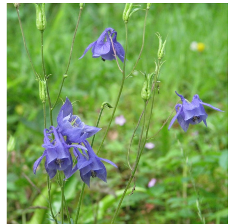
Flours et fruits de l'Ancolie commune.