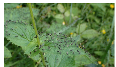
Essaim de fourmis volantes sur des pieds d'Ortie dioïque.

Trifolium montanum subsp. gayanum (Godr.) O.Bolòs & Vigo, 1974