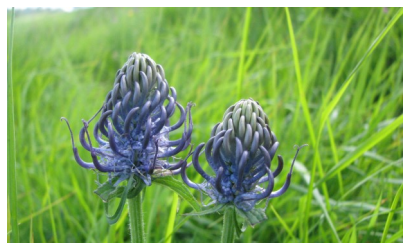
Raiponce des Pyrénées