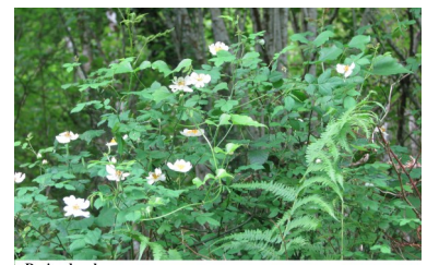
Rosier des champs