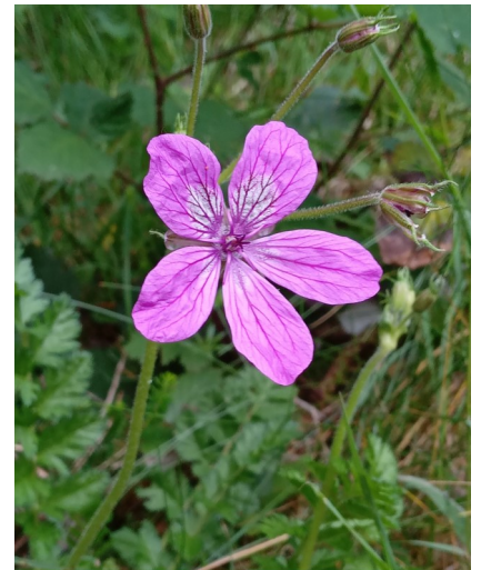
Erodium de Manescau