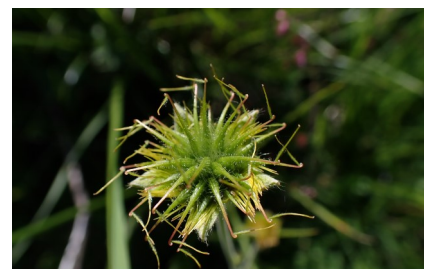
Les akènes récurvés de la Benoîte des Pyrénées