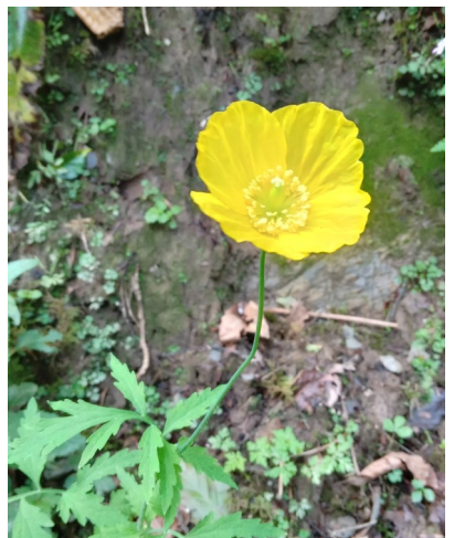
Pavot du Pays de Galles

Leontopodium nivale subsp. alpinum (Cass.) Greuter, 2003