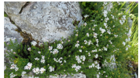
Aspérule hérissée Asperula hirta Ramond, 1800