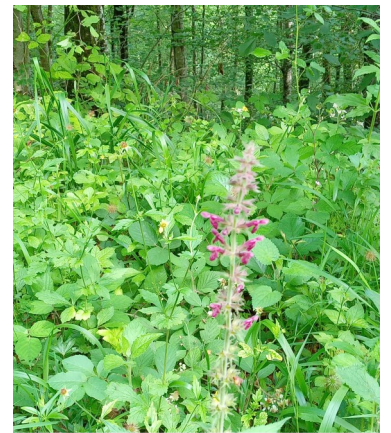
Epiaire des bois