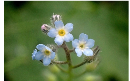
Myosotis très rameux Myosotis ramosissima subsp. ramosissima Rochel, 1814