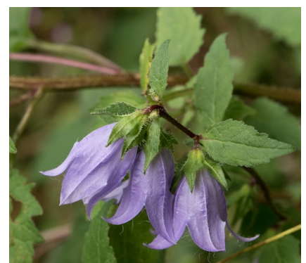
Campanule à feuilles d'ortie

Campanula trachelium subsp. trachelium L., 1753