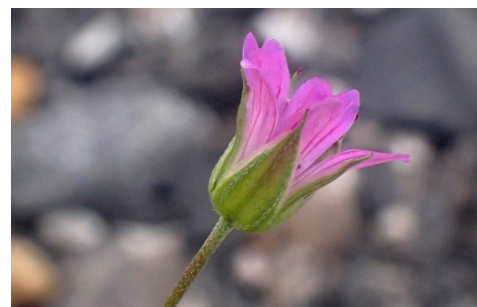
Géranium colombin Geranium columbinum L., 1753