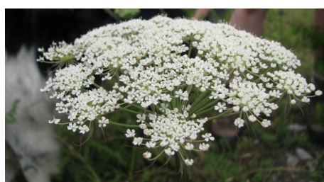
Libanotis des Pyrénées Libanotis pyrenaica subsp. pyrenaica (L.) O.Schwarz, 1949