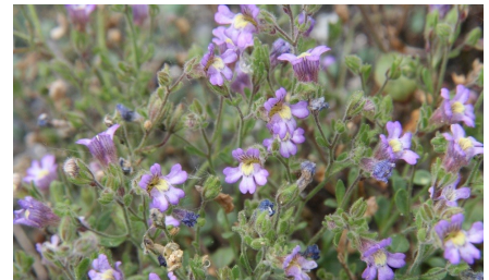
Linaire à feuilles d'origan

Centaureum erythraea subsp. erythraea Rafn, 1800