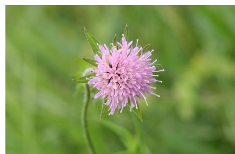
Knautie d'Auvergne Knautia arvernensis (Briq.) Szabó, 1934