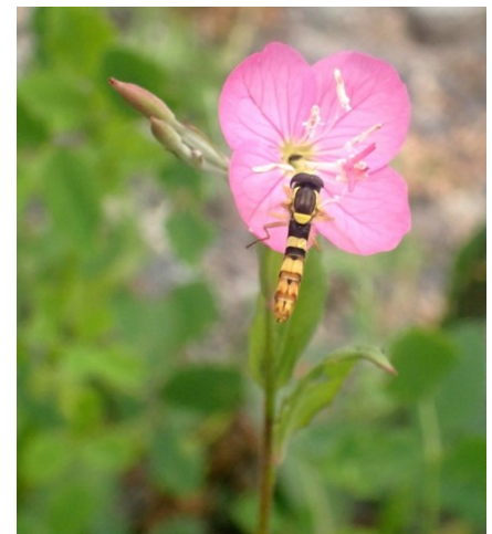
Onagre rose Oenothera rosea L'Hér. ex Aiton, 1789