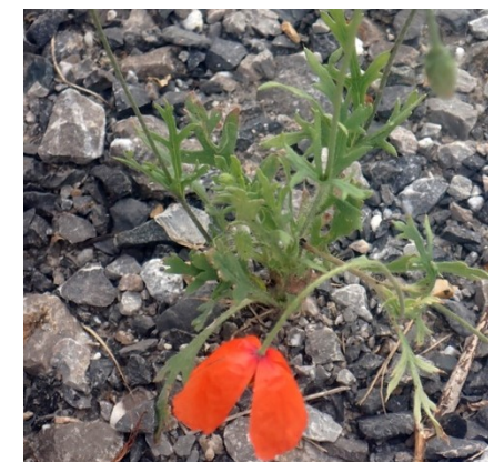
Pavot douteux Papaver dubium L., 1753