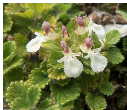
Germandrée des Pyrénées