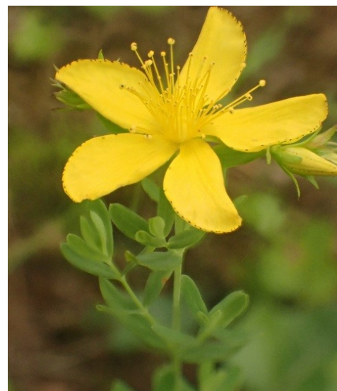
Millepertuis perforé Hypericum perforatum L., 1753