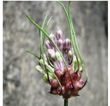
Ail des vignes