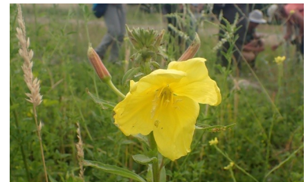
Onagre à grandes fleurs Oenothera glazioviana Micheli, 1875