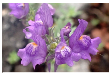
Linaira des Alpes Linaria alpina subsp. alpina (L.) Mill., 1768