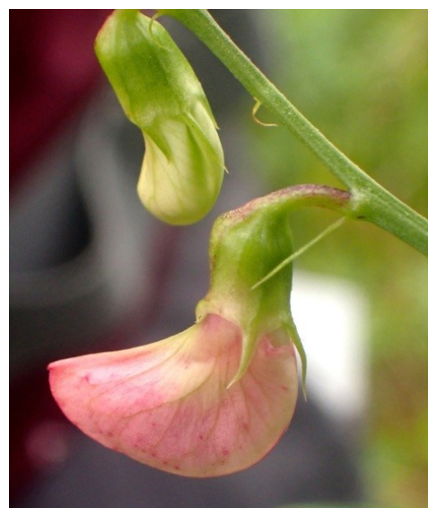
Gesse sylvestre Lathyrus sylvestris L., 1753