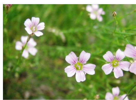
Tunique saxifrage Petrorhagia saxifraga (L.) Link, 1829