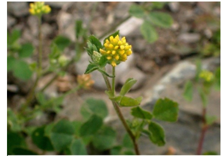
Luzerne lupuline Medicago lupulina L., 1753