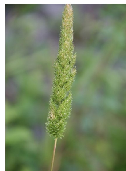
Koélérie à crête

Petrosedum sediforme (Jacq.) Grulich, 1984