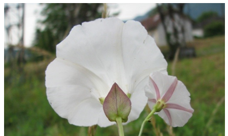
Observation du calice des deux liserons :

Cirsium vulgare subsp. vulgare (Savi) Ten., 1838