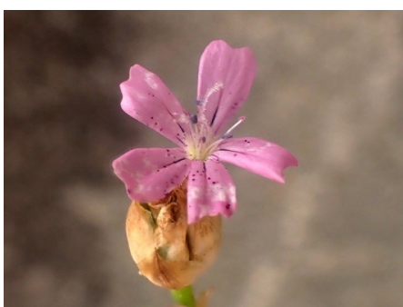
Tunique prolifère Petrorhagia prolifera (L.) P.W.Ball & Heywood, 1964