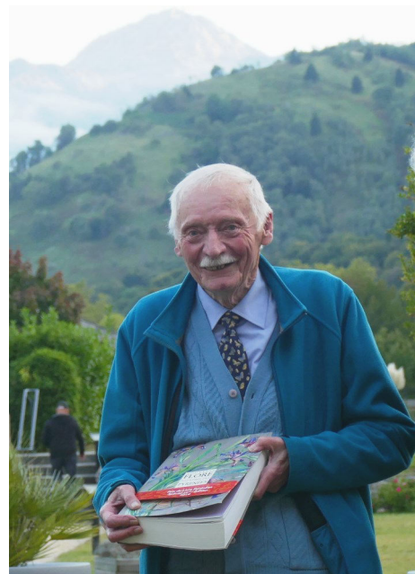
Salon du livre de Bagnères 2019