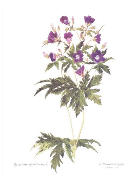
Géranium des bois / Aquarelle de Roger de Bouillé

● Jeudi 24 juillet (journée): Montagne verte / aquarelle de fleurs (20 €) Balade sur les pas du Comte de Bouillé Renseignements et inscription : Nathalie MAGROU, Tél. : 06 45 70 30 07