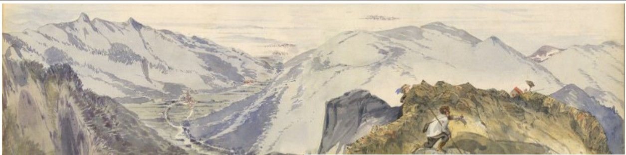
La vallée d'Ossau vue du Pic du Ger / Aquarelle de Roger de Bouillé

Site Internet : http://www.pierrinegastonsacaze.com Email : assogastonsacaze@gmail.com Tél : 05 59 34 93 63