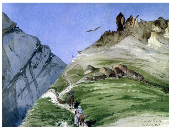
Col de Tortes / Aquarelle de Roger de Bouillé

● Mardi 29 juillet (journée): Col de Tortes / aquarelle de paysages (26 €) Balade sur les pas du Comte de Bouillé Renseignements et inscription : Francine MAGROU, Tél. : 06 80 42 55 59