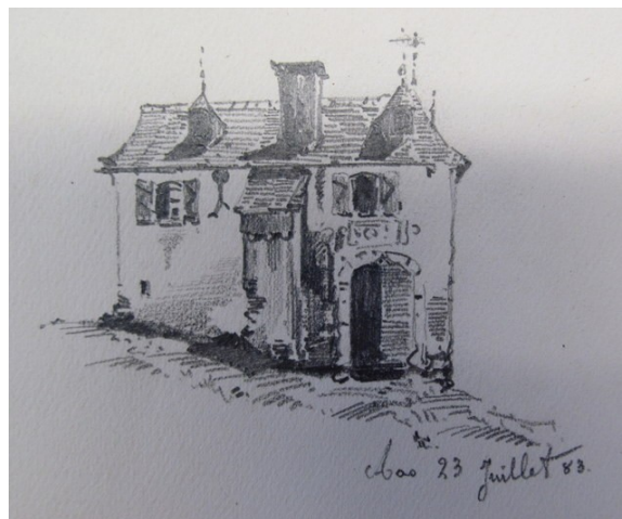
Dessin de Roger de Bouillé