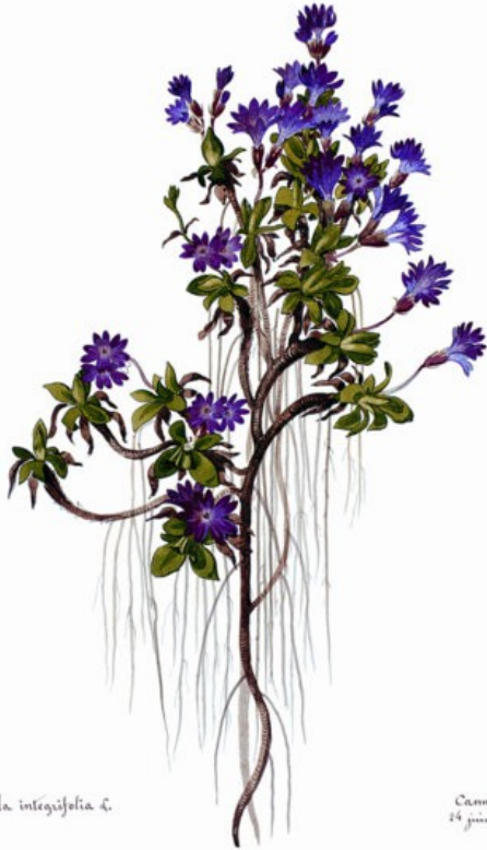
Primula integrifolia L.